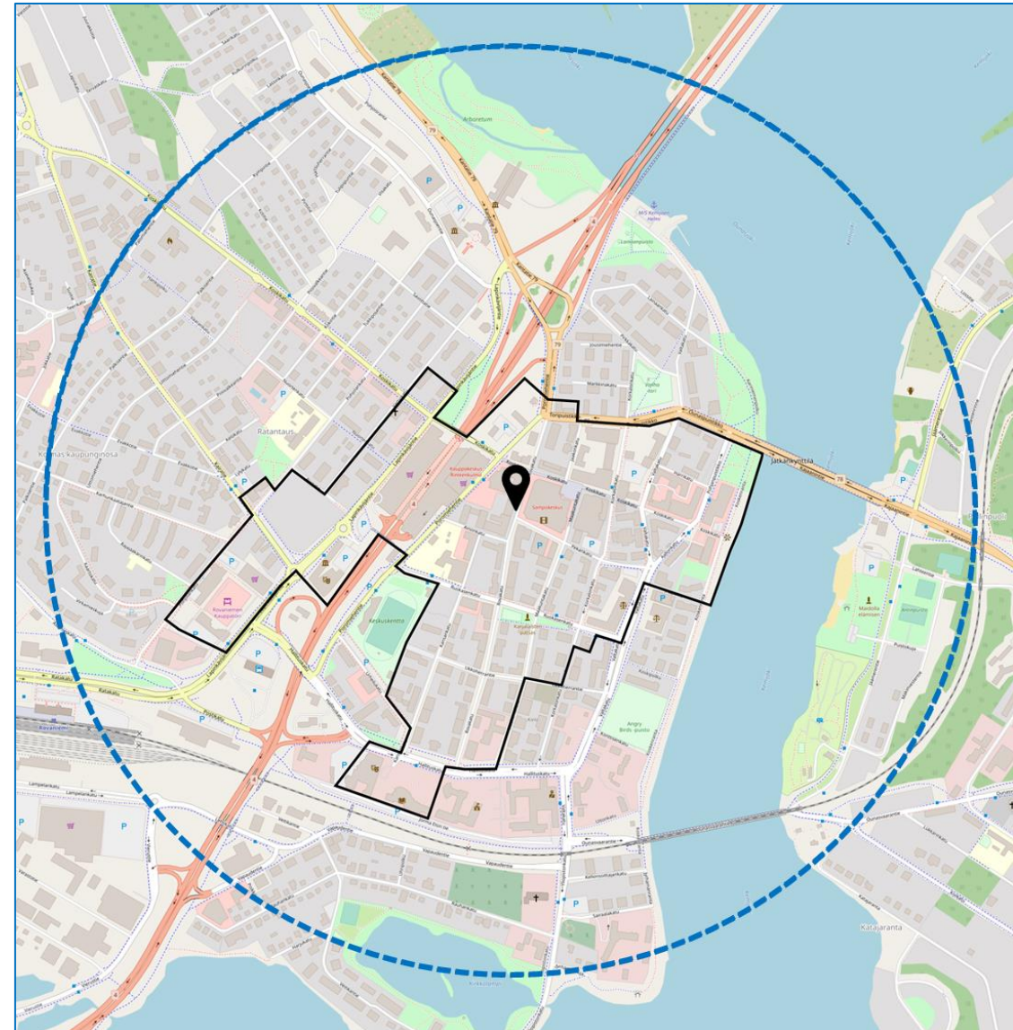
Kartta: Rovaniemen keskusta (ALL-in) ja Vartin keskusta-alue. Pohjakartta: Open Street Map Contributors.

* YKR-aineisto perustuu ruututietoihin (250 m x 250 m). Aineiston tuottajia ovat Tilastokeskus ja SYKE.